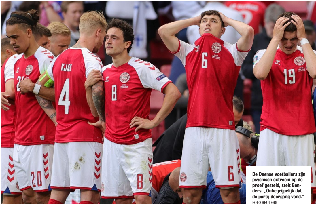
De Deense voetballers zijn psychisch extreem op de proef gesteld, stelt Benders. „Onbegrijpelijk dat de partij doorgang vond.”